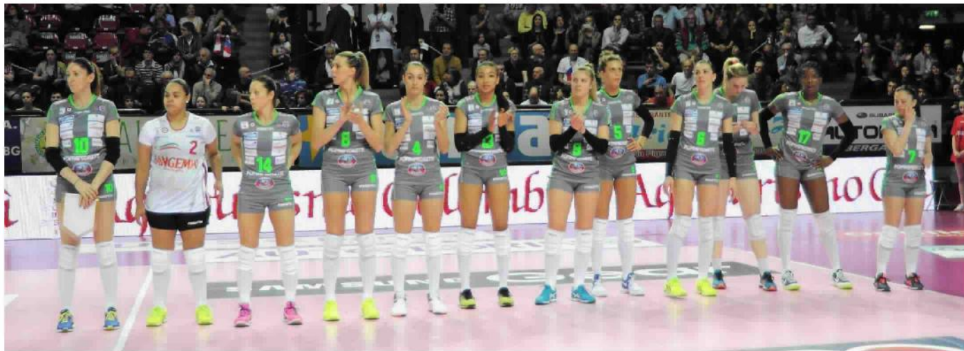
Un'immagine d'archivio della Foppa

VOLLEY SERIE A1 Le rossoblù espugnano Modena al quinto set dopo una battaglia serrata